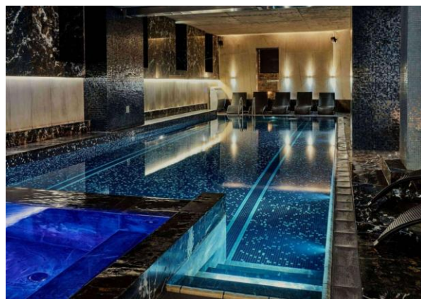
Noen bilder fra hotellet Wyndham 5*

Er det kunst som frister så huser Rådhuset også et kunstmuseum, «Byfolkets Kunstmuseum», som har en kolleksjon som inkluderer malerier, tegninger og grafikk fra 19- til 2000 tallet og knyttet til Wroclaws historie.