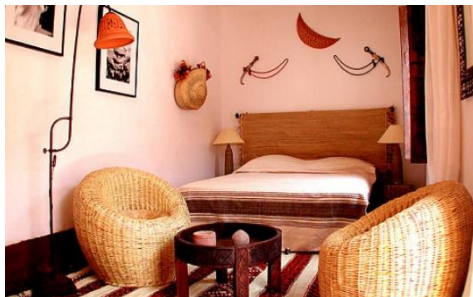
TICHKA 108 TWIN m Dusj