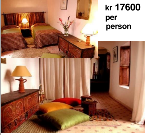
OUZOU D 106 DOBBELT m Dusj