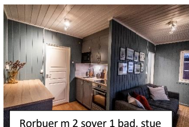
Rorbuer m 2 sover 1 bad, stue

Avbestilles turen fra 90 - 61 dager før avreisedato, vil det kreves 50 % av turprisen. Avbestilles turen 60 dager eller mindre før avreisedato, eller ved manglende fremmøte på avreisedagen, vil 100 % av turprisen kreves inn. Det samme gjelder dersom man mangler nødvendige papirer for å delta på hele reisen. Be eventuelt om å få tilsendt våre "standard reisevilkår og avbestillingsrealer i sin helhet"