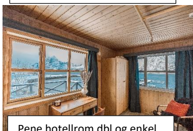
Pene hotellrom dbl og enkel