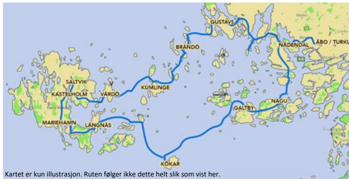
Kartet er kun illustrasjon. Ruten følger ikke dette helt slik som vist her.

Denne reisen gjennom Finlands vakre skjærgård kalles « Skjærgårds Ringen ». En utmerket mulighet til å bli kjent med Ålands og Åbolands skjærgård! Vi reiser mellom øyene på ferger og med buss langs smale veier og over mange broer. Vi får også oppleve båt-turer ut til de lengst bort-liggende øyene! Den totale lengden på selve ringen er ca. 250 kilometer + tilknytningen fra Åland. Oftest slutter eller begynner reisen i Åbo. Fordi vi starter turen med en forlenget del helt fra Ålands skjærgård blir det naturligvis enda mye mere å se og oppleve. På veien i «fasta Finland» bruker vi tiden til å bli kjent med den sjarmerende byen Åbo og Nådendal (Tove Janssons Mumin-trollene bor her). Vi må selvsagt i Sauna – og oppleve ekte finsk mat og kultur.