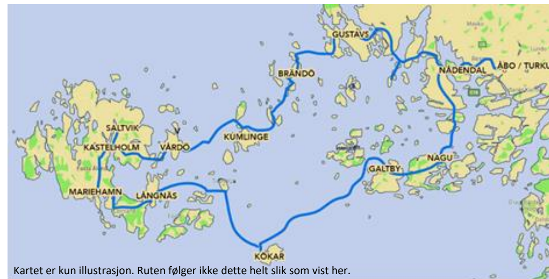
Kartet er kun illustrasjon. Ruten følger ikke dette helt slik som vist her.

Denne reisen gjennom Finlands vakre skjærgård kalles « Skjærgårds Ringen ». En utmerket mulighet til å bli kjent med Ålands og Åbolands skjærgård! Vi reiser mellom øyene på ferger og med buss langs smale veier og over mange broer. Vi får også oppleve båt-turer ut til de lengst bort-liggende øyene! Den totale lengden på selve ringen er ca. 250 kilometer + tilknytningen fra Åland. Oftest slutter eller begynner reisen i Åbo. Fordi vi starter turen med en forlenget del helt fra Ålands skjærgård blir det naturligvis enda mye mere å se og oppleve. På veien i «fasta Finland» bruker vi tiden til å bli kjent med den sjarmerende byen Åbo og Nådendal (Tove Janssons Mumin-trollene bor her). Vi må selvsagt i Sauna – og oppleve ekte finsk mat og kultur.